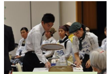
喫茶サービス競技