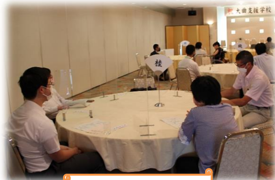
同窓会総会の様子

成人を祝う会では、新成人に記念品と花束が贈呈されました。新成人代表挨拶では、成人を迎えた喜び、家族や周りの方々への感謝の気持ち、未来への抱負などが聞かれました。同窓生と学校職員との会話に花が咲き、在学時代を振り返るとても和やかな時間となりました。